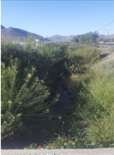
Estado del canal antes de la limpieza

Los días 17 al 19 de enero y 24 al 28 de enero de 2021, se realizaron trabajos de conservación en el canal matriz Mal Paso, los que consistieron en limpieza y retiro de vegetación y basura del canal, mediante maquinaria pesada excavadora. El objetivo de dichas labores es disminuir pérdidas y tiempos de traslado de aguas. Los trabajos los realizó constructora PRIMAQ y tuvieron un costo de 4.725.000+IVA, pagados a través de saldo anexo convenio Caserones/JVRC.